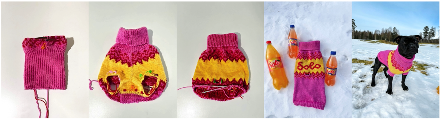
Bildene viser en eksempelgenser. Plasseringen på mønsteret, samt hvor ofte det økes/felles avhenger av målene til hunden.