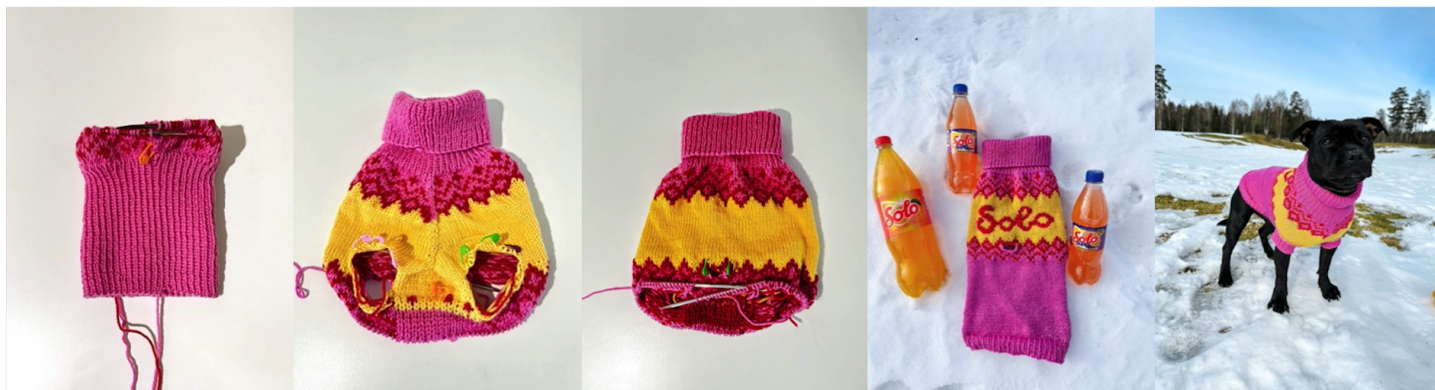
Bildene viser en eksempelgenser. Plasseringen på mønsteret, samt hvor ofte det økes/felles avhenger av målene til hunden.

hullet til det andre beinet. Strikk en runde rett over alle maskene. Det skal være 104 masker på pinnen.